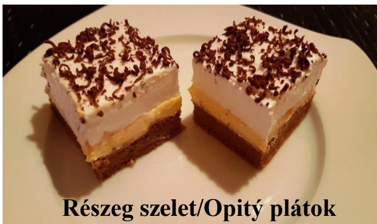
Részeg szelet/Opitý plátok